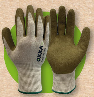
E-NATURE-GRIP 52-000 Art. nr. 1.52.000.00

TESTINSTITUUT Deze handschoenen zijn gecertificeerd door: CTC (Notified Body no. 0075), 4 Rue Hermann Frenkel 69367 Lyon, Cedex 07, Frankrijk. Voor een kopie van de conformiteitsverklaring verwijzen wij u graag door naar de volgende weblink: www.oxxa.work/doc